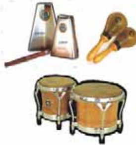
7 BONGÓ, CAMPANA y MARACAS