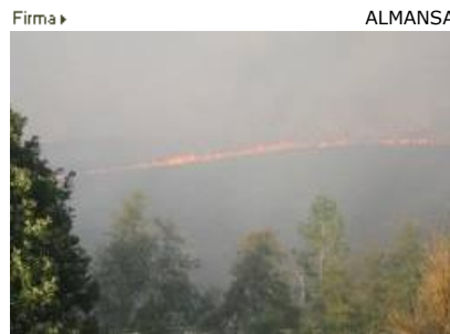
El incendio de Magaz de la Cepeda fue el que más superficie arrasó

Los primeros once días de noviembre también fueron tranquilos. Se ocasionaron 57 incidentes, pero todos fueron de dimensiones reducidas y en total arrasaron con 125 hectáreas, en su mayoría de matorral y pasto.