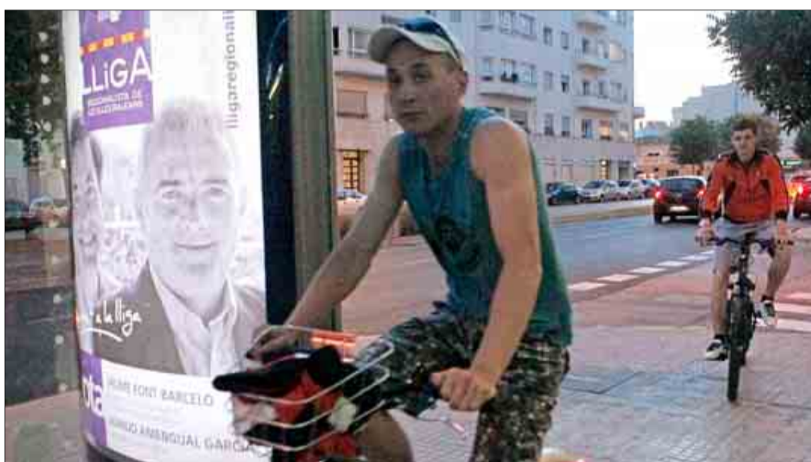
Restos del naufragio: dos jóvenes ciclistas pasan junto a uno de los carteles de la Lliga de Jaume Font.