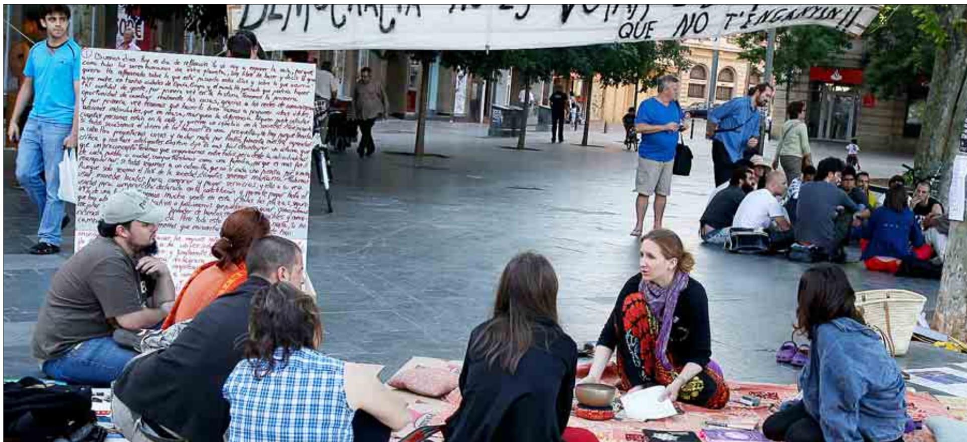
Un día después de las elecciones, grupos de jóvenes seguían acampados en la Plaza de España formando corrillos y rodeados de pancartas.

«De la primavera árabe al verano europeo» (Indignados de la Plaza de España)