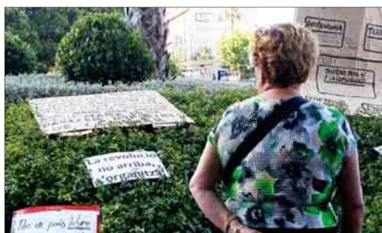
Una mujer lee las proclamas de los 'indignados' colocadas sobre los setos.