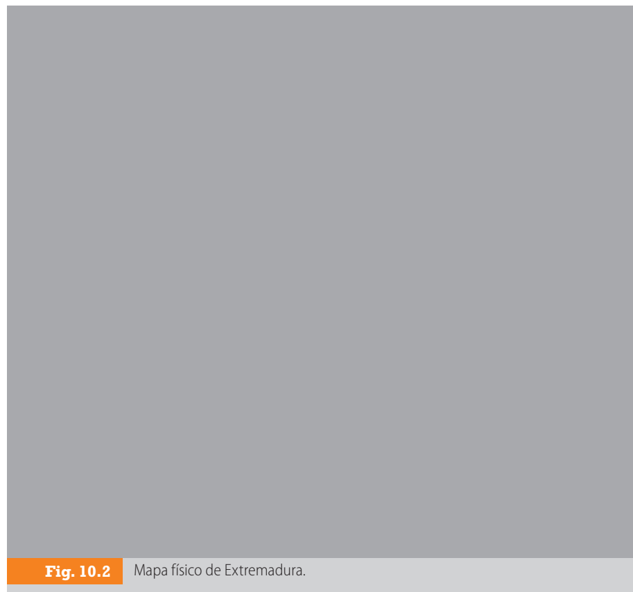
Fig. 10.2 Mapa físico de Extremadura.