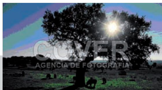
Fig. 10.1 Las dehesas constituyen uno de los paisajes más característicos del ámbito rural extremeño.

En nuestra Comunidad se distinguen tres unidades principales del relieve: los sistemas montañosos , las penillanuras y los valles fluviales . En su conjunto se diferencian siete grandes bloques físicos, que de norte a sur son los siguientes: el Sistema Central, el valle del Tajo, la penillanura cacereña, los Montes de Toledo, las Vegas del Guadiana, la penillanura de la Serena-Tierra de Barros y Sierra Morena.