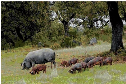
Fig. 10.10 Las especiales condiciones para la explotación ganadera del cerdo ibérico, en las características dehesas, han hecho de éste un producto de alta rentabilidad económica.

Es otra parcela del sector primario de mucha importancia en Extremadura, y que se reparte por toda la Comunidad. Los tipos de ganado más abundantes son el ovino, el porcino, el bovino, el caprino y el avícola. El ganado porcino produce la mayoría de los productos cárnicos extremeños, muy solicitados por su calidad. La variedad de cerdo ibérico es especialmente apreciada, y las industrias cárnicas y de salazones relacionadas con este sector están teniendo un gran auge en los últimos años, y un gran potencial de crecimiento en el futuro.