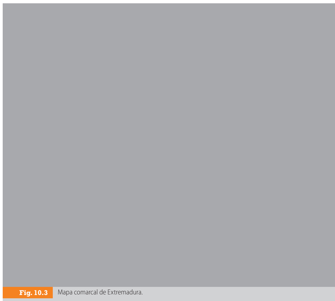
Fig. 10.3 Mapa comarcal de Extremadura.

A su vez, el territorio está dividido en comarcas, que corresponden a agrupaciones de pueblos y ciudades que comparten características arquitectónicas, paisajísticas, climáticas e incluso costumbres y formas de vida tradicionales. Así, entre las comarcas extremeñas hay una gran diversidad de paisajes, climas y costumbres: desde las comarcas del norte de Cáceres (Las Hurdes, Sierra de Gata, Valle del Ambroz, Jerte, etc.), de relieve abrupto, lluvias abundantes y una arquitectura de piedra y pizarra en sus municipios, hasta las comarcas del sur de Badajoz (La Campiña, Jerez de los Caballeros, Tentudía, etc.), donde el relieve es más suave, las precipitaciones son más escasas, los cultivos cerealísticos y las dehesas de encinas dominan el paisaje, y la arquitectura de sus pueblos se caracteriza por las casas encaladas de blanco.