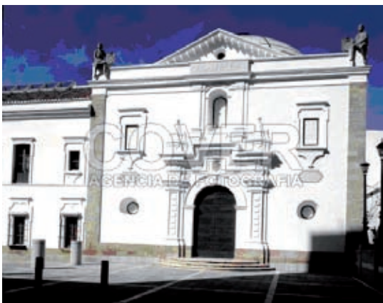
Fig. 10.18 Edificio de la Asamblea de Extremadura.

La Junta de Extremadura , que es la institución que ejerce el poder ejecutivo. Sus funciones se concretan en aplicar, desarrollar y hacer cumplir las leyes autonómicas. La sede de la Junta se encuentra en Mérida, donde están la Presidencia y las diferentes Consejerías. La Junta está formada por el Presidente y por nueve consejeros y consejeras: Agricultura y Medio Ambiente, Economía y Trabajo, Infraestructuras y Desarrollo Tecnológico, Educación, Cultura, Bienestar Social, Sanidad y Consumo, Desarrollo Rural, y Hacienda y Presupuesto.