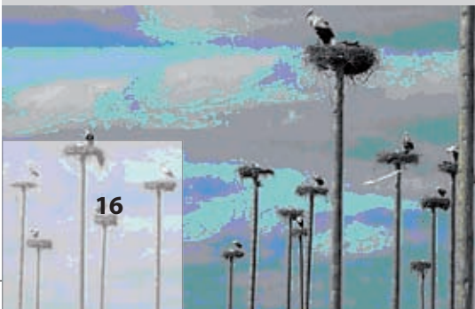
Fig. 10.17 Las administraciones públicas y las diversas asociaciones en defensa de la naturaleza promueven numerosas actuaciones para el mantenimiento de los valores naturales en Extremadura.