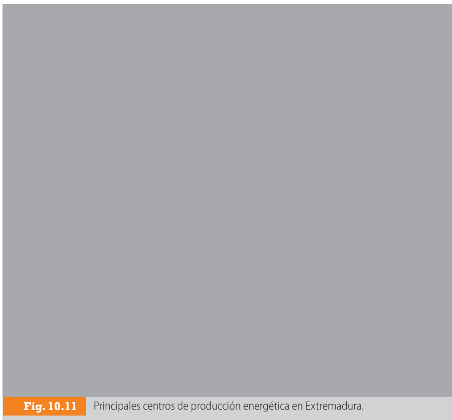
Fig. 10.11 Principales centros de producción energética en Extremadura.

En lo referente a las fuentes de energía renovables, en el año 2005 se estableció la regulación normativa de los parques eólicos de la Comunidad, y durante el año 2006 se empezaron las adjudicaciones de los mismos. Otra alternativa muy rentable en la región es la energía solar en sus dos vertientes, fotovoltaica y termosolar. En Alburquerque (Badajoz) se sitúa el mayor parque solar de España. Por último, mencionar la energía que se puede obtener de los desechos orgánicos vegetales; en la localidad de Los Santos de Maimona (Badajoz) se está instalando una planta de producción de biodiesel a partir de los desechos que genera la industria olivarera.