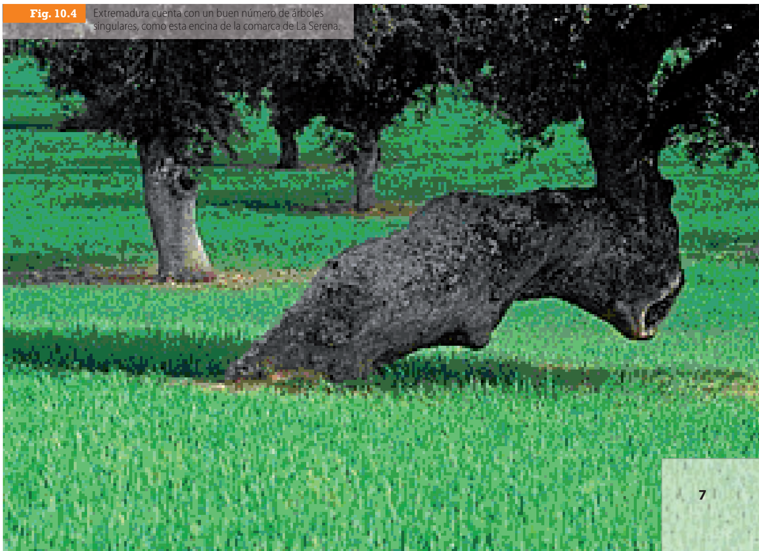
Fig. 10.4 Extremadura cuenta con un buen número de árboles singulares, como esta encina de la comarca de La Serena.