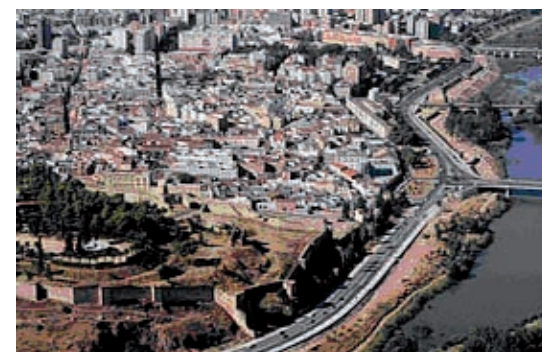
De origen estratégico y militar, en la actualidad la ciudad de Badajoz, como la mayoría de ciudades extremeñas, tiene un carácter multifuncional. Fig. 10.8

Desde el punto de vista productivo, las zonas más importantes son los valles del Alagón, el Tiétar y el Jerte, así como las vegas del Guadiana y la comarca de Tierra de Barros.